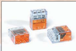
HelaCon Plus 3 voies (HECP-3).