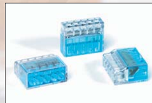
HelaCon Plus 5 voies (HECP-5).