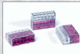
HelaCon Plus 6 voies (HECP-6).