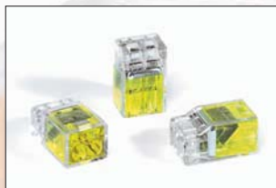
HelaCon Plus 2 voies (HECP-2).

Toute la gamme HelaCon Plus est certifiée conforme aux Normes EN 60998-1 et EN 60998-2-2.