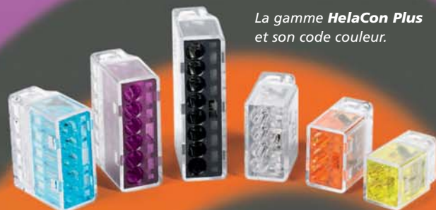
La gamme HelaCon Plus et son code couleur.

Les bornes de connexion HelaCon Plus utilisent une technique nouvelle à double ressort afin de faciliter le travail des installateurs dans toutes les situations, notamment dans les endroits difficiles d'accès ou en hauteur. Ces produits sont utilisables aussi bien dans les habitations que dans les bâtiments publics ou industriels.