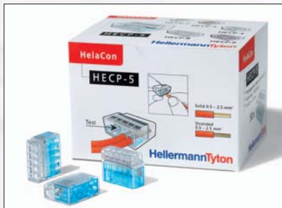
La boîte HelaCon Plus.