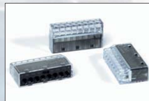
HelaCon Plus 8 voies (HECP-8).