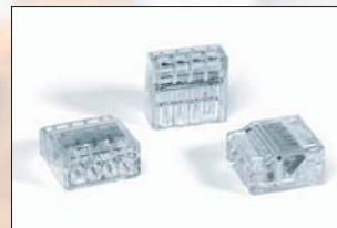
HelaCon Plus 4 voies (HECP-4).