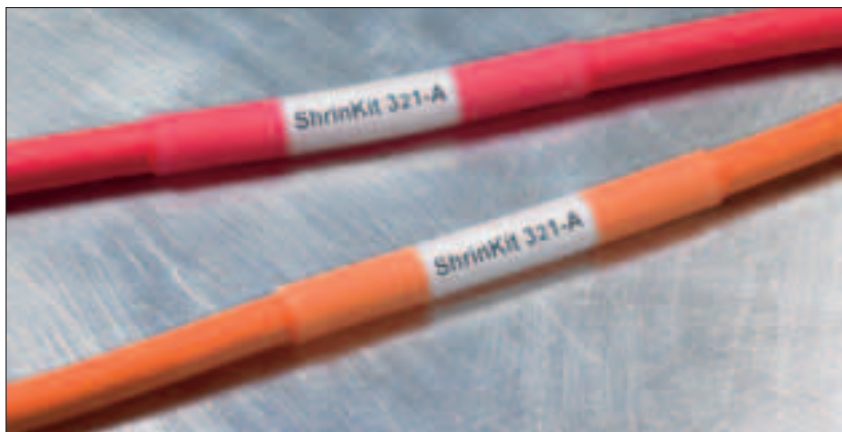
ShrinKit 321-A : protection permanente de solutions d'identification.

Ce kit contient un assortiment de manchons d'usage général clairement rangés. Le coffret comporte 4 tailles en noir et transparent.