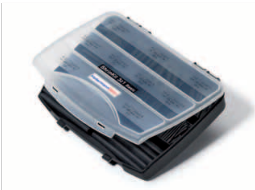
ShrinKit 321 Basic.

Ce kit contient une sélection de gaines noires très largement utilisées, en 5 dimensions et différentes longueurs.