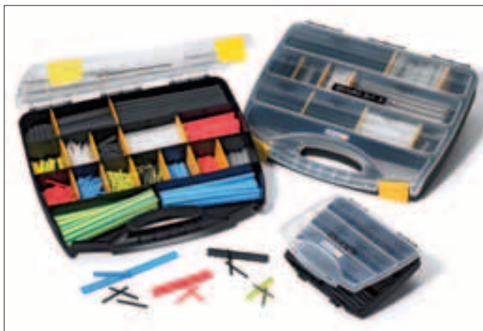
Quelle que soit l'application, vous avez à portée de main la bonne dimension de gaine : ShrinkKit 321 Universal, ShrinkKit 321-A et ShrinkKit 321 Basic.

ShrinkKit 321 est une famille constituée de trois assortiments de gaines thermo-rétractables présentés dans des coffrets attrayants et pratiques. La gamme se décline en ShrinkKit 321 Universal, ShrinkKit 321 Basic et ShrinkKit 321-A (gaine à paroi adhésivée). Avec un taux de rétreint idéal de 3:1, ces produits remplacent une palette de gaines de diamètres très différents en répondant pratiquement à toutes les exigences en matière de gaines thermo-rétractables. Il est extrêmement simple de choisir le bon produit car les manchons sont clairement identifiés par diamètre, longueur et le contenu est imprimé sur chaque compartiment des coffrets d'assortiment.