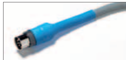
Taux de rétreint 3:1 pour élargir la gamme d'applications.

Le kit contient un assortiment de gaines à usage général clairement rangé en diverses tailles et couleurs. Grâce à son taux de rétreint idéal de 3:1, il remplace de nombreuses tailles différentes de gaines. ShrinkKit 321 Universal peut couvrir une gamme de diamètres allant de 1 à 20 mm.