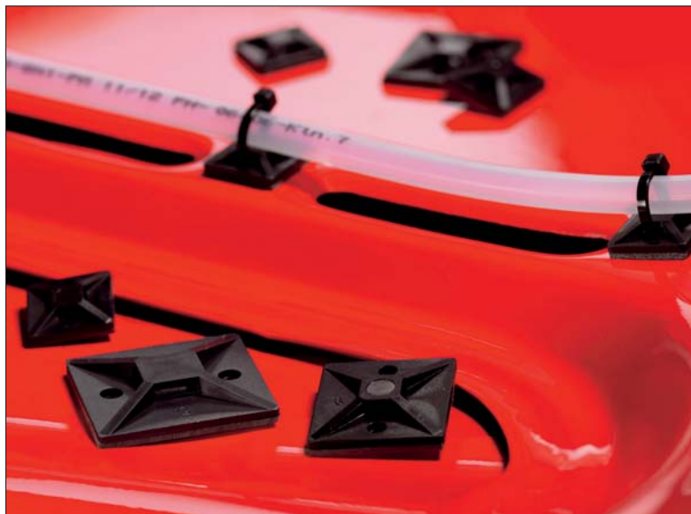
SolidTack®-serie komen tot hun recht op gelakte en van poedercoating voorziene oppervlakken.

Deze zadels komen tot hun recht op gelakte en van poedercoating voorziene oppervlakken, zoals gangbaar in trein- en tramstellen, luchtvaart en automotive. De zadels kunnen tevens worden toegepast op kunststof oppervlakken, in oneindig veel toepassingen.